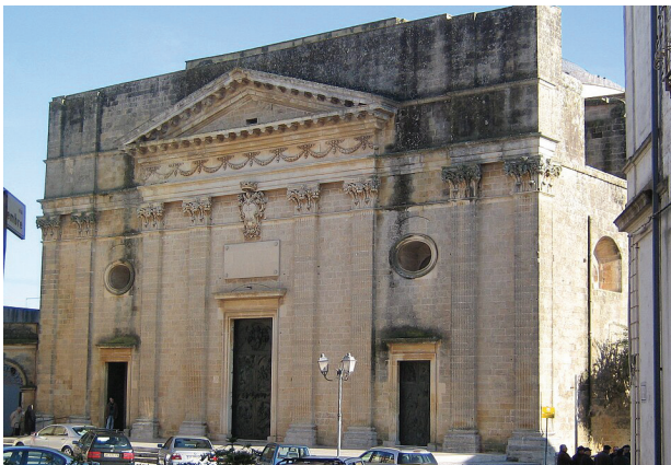
Fig. 3 - Chiesa Collegiata di San Salvatore, Alessano (Lecce) (di Colar, CC BY-SA 3.0, https://commons.wikimedia.org/w/index.php?curid=18909607 ).